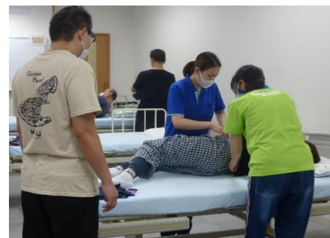
介護実践室での授業の様子

Point! 初任者研修の資格が取得できます！ 介助者の腰痛を予防し、利用者が安全・安心・安楽に介助を受けられる技術、ボディメカニクスの基礎を習得します。