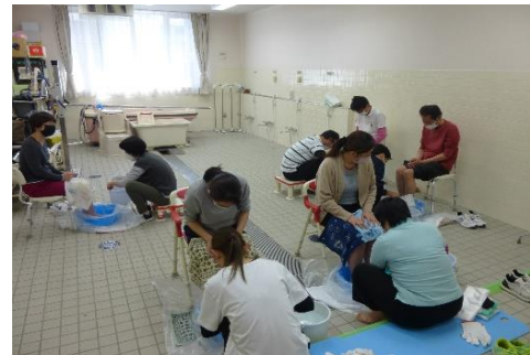
入浴実践室での授業の様子

Point! 初任者研修の資格が取得できます！ 介助者の腰痛を予防し、利用者が安全・安心・安楽に介助を受けられる技術、ボディメカニクスの基礎を習得します。