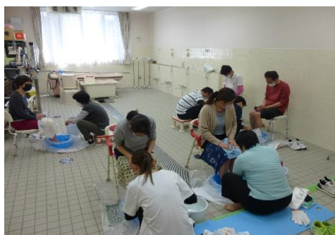
入浴実践室での授業の様子

介助者の腰痛を予防し、利用者が安全・安心・安楽に介助を受けられる技術、ボディメカニクスの基礎を習得します。