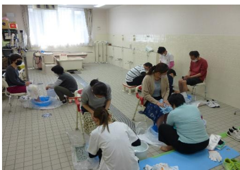
入浴実践室での授業の様子

利用者が安全・安心・安楽に介助を受けられる技術、介助者の腰痛を予防するボディメカニクスの基礎を習得します。 受講生が実技を行う側と受ける側に分かれて実施します。