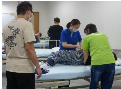
介護実践室での授業の様子