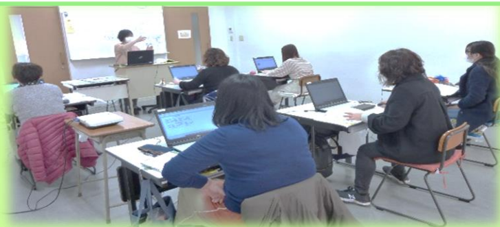
パソコン授業の様子

事務職において必要なパソコンスキル（Word・Excel・PowerPoint）を基礎から学べます。機能の理解から応用力を身につけ、様々な場面で対応できる人材となり、今後役に立てることが出来ます。