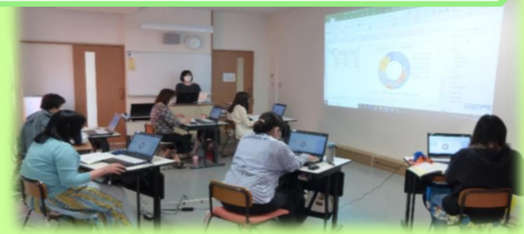
パソコン授業の様子