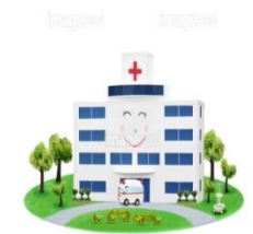
総合病院の 外来受付に就職