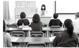
コース説明の様子

神奈川県委託訓練「即戦力」1月生簿記パソコン事務科、医療調剤介護事務・PC科、介護職員初任者研修科のコース説明会が10月17日(火)、10月25日(水)、11月2日(木)の3日間にわたり開催されました。