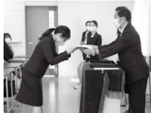
修了証書授与の様子