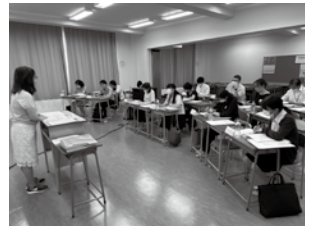
職業訓練について説明する様子

当日は神奈川県・東京都のハローワークならびに求職者支援機構の訓練担当職員合わせて13名が参加されました。日頃より受講生の職業相談に関わっておられるハローワークの担当者様に、職業訓練の実施状況や、受講生の授業の様子を直に視察していただくとともに、当研修センターの行う再就職支援についても知っていただく貴重な機会となりました。