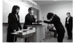
修了証書授与の様子

4月生(2ヵ月コース)修了式 6月16日(金) 3月生(3ヵ月コース)修了式 6月23日(金) 7月生(3ヵ月コース)入校式 7月 3日(月)