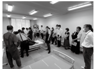
介護実践室にて「介護実技」授業見学の様子