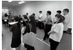
パソコン授業の見学の様子(305教室)

大和ハローワーク、横浜ハローワーク、相模原ハローワーク、平塚ハローワーク、港北ハローワーク、横須賀ハローワーク、新宿ハローワーク、求職者支援機構