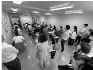
教室にて「医療事務」座学授業見学の様子