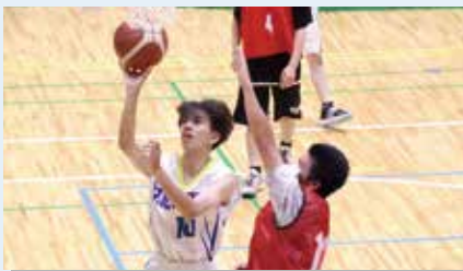
▲「全国高等専修学校体育大会」