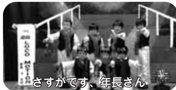
さすがです、年長さん