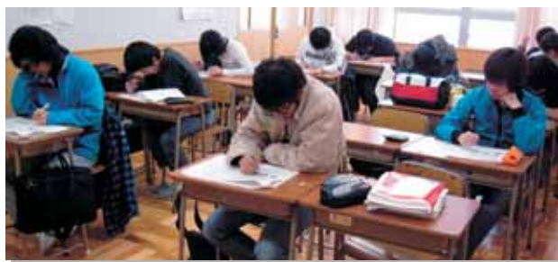
経理実務コンクール