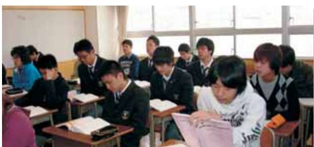
2級ヘルパー講習会