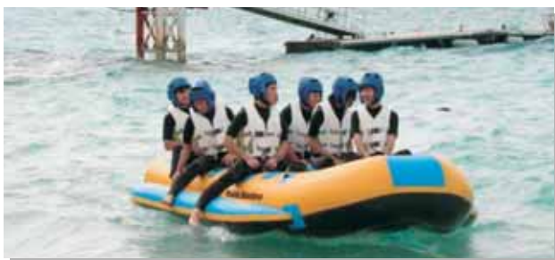
修学旅行・マリン体験

新しい年を迎え柏木学園は、時代の要請に応えた教育のさらなる充実発展を目指して一層努力をしてみたいです。学園関係の皆様、本年も相変わらず一層のご支援ご鞭撻の程よろしくお願い申し上げます。