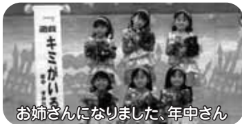
お姉さんになりました、年中さん