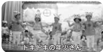
ドキドキの年少さん

今年も感染症等でご心配をおかけしましたが、全クラス無事に終わることが出来ました。子ども達一人ひとりが楽しく取り組めるよう、各クラス工夫をこらし、時には先生達も力が入り過ぎてしまうこともありました。子ども達との信頼関係があってこそその対応なので、子ども達も応えようと必死な姿が見られました。本番を迎えるにあたり、多くの保護者の方にお手伝い頂き、当日も本部役員・実行委員の方々、朝早くから遅くまで本当にありがとうございました。