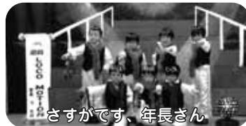
さすがです、年長さん