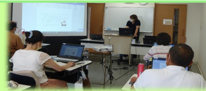
パソコン授業の様子